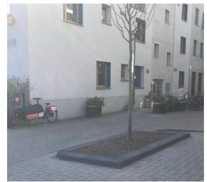
und schon aus dem Bild gewachsen